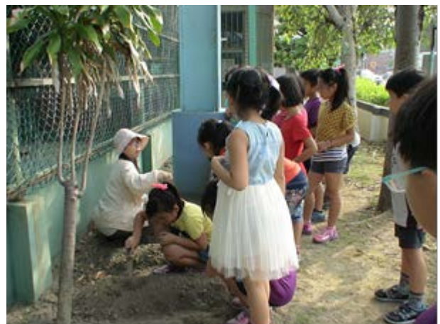
說明：班級利落葉堆肥區闢為農園，配合四健會推廣，實施蔬菜種植教學體驗活動。