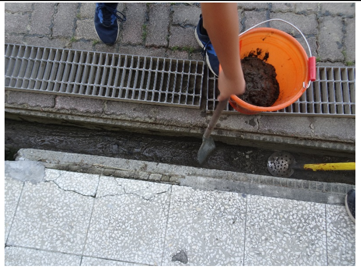
說明：利用回收土，種植花木，以減少垃圾量。