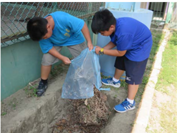
說明：班級打掃完畢收集落葉堆放收集區，讓大自然資源得以循環再利用。