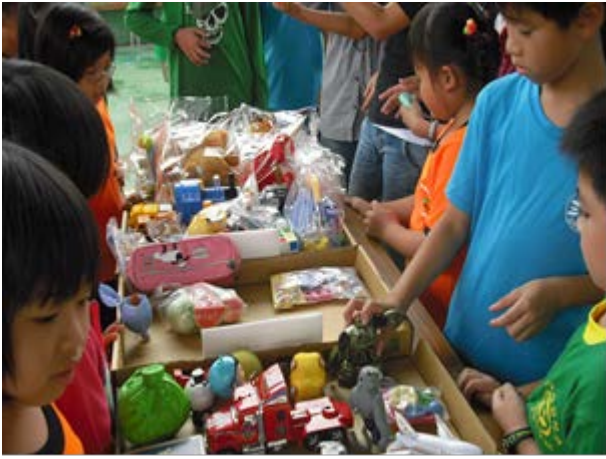
說明：辦理愛心跳蚤市場活動，讓二手玩具物盡其用找到新主人。