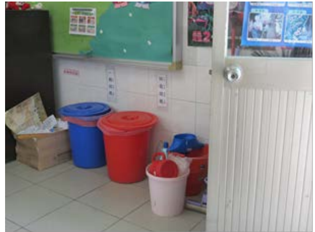
說明：垃圾分類融入學生日常生活，各班級教室皆設有垃圾分類角。