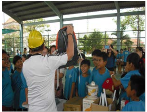
說明：募集愛心人士捐贈物資，透過拍賣活動，讓有需要的人買回又能發揮愛心，一舉數得！