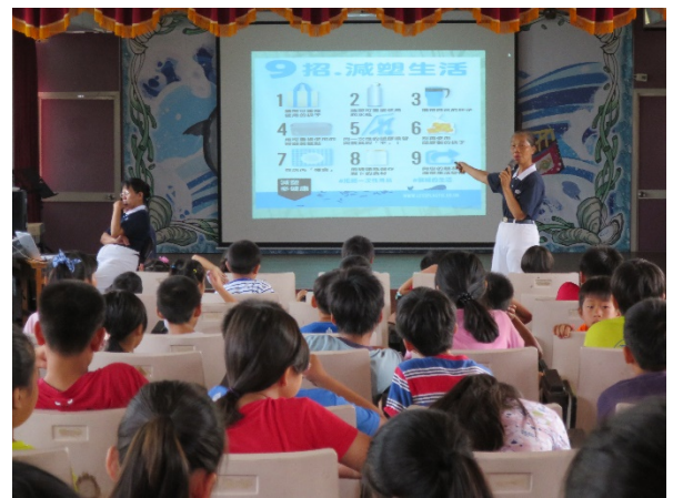
說明：利用週三集會辦理減塑宣導活動