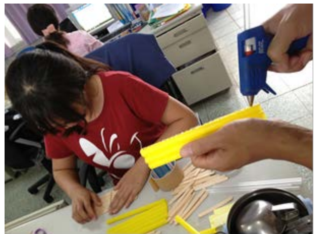
說明：指導小朋友利用回收物品，作能源玩具。