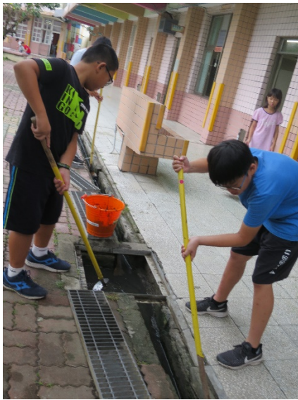
說明：學生清理水溝泥沙，堆放花台做堆肥，充分運用大自然資源。