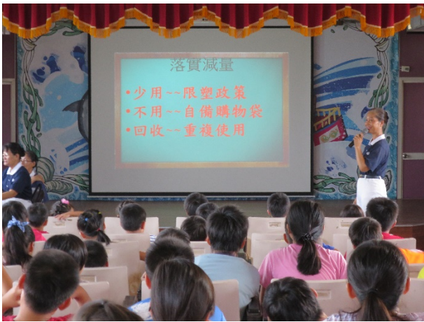
說明：辦理資源循環再利用宣導活動。