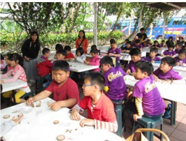
說明：安排環境教育課程，教導小朋友利用廢棄的木頭做出可愛的裝飾品。