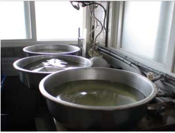
說明：廚房回收洗菜水，用來澆灌花木。